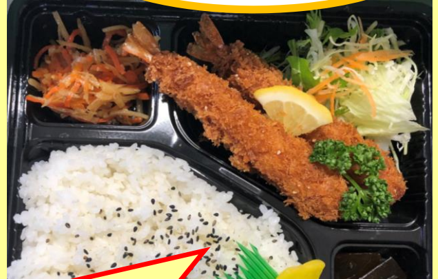
エビフライ弁当 500円